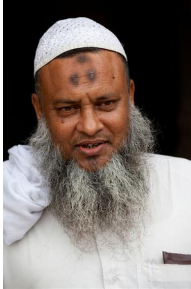
Fig. 2 : un homme musulman portant la marque de la zabiba due à ses prières répétées

Marc 4 : 26-29, mais il n'y est point question d'une marque au niveau du visage. Dans le livre de l'Apocalypse, Jean parle de sa vision dans laquelle il affirme avoir vu 144 000 personnes « qui avaient son nom [= celui de l'agneau] et le nom de son Père écrits sur leurs fronts » (Apocalypse 14 : 1).