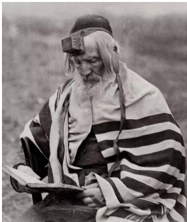
Fig. 3 : photographie d'un Juif à Padolsk portant des tephillin (Odessa, Ukraine, vers 1875).